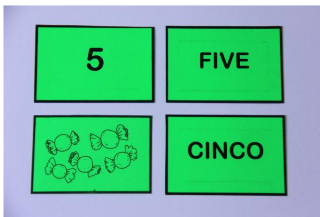
Figura 2: Cartas

Levando em consideração a dificuldade dos alunos de irem além da relação de ordem, foi discutido sobre o que é número e como representá-lo. “Números são símbolos que expressam quantidades, grandezas, posições, medidas ou códigos” (RAMOS, 2009, p. 31). Já “numerais são palavras que quantificam os elementos, ou indicam sua ordem de sucessão” (RAMOS, 2009 p. 31). Então, o que os alunos da licenciatura tinham no baralho? Tomando o 5 como exemplo, tinham o número 5, representado pelo algarismo 5, os numerais “cinco” e “five”, em língua portuguesa e língua inglesa, e ainda a quantidade cinco, representada pela imagem dos bombons (Figura 2).