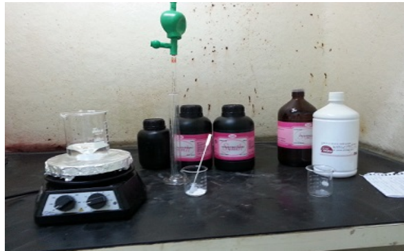
Figura 1: Seleção dos reagentes

Primeiramente foram selecionadas amostras de materiais que fossem passíveis de serem reproduzidos pelo método de réplica por Pechini, fibras de algodão, fibras de algodão trançadas (barbante), fibras de algodão entrelaçadas (gaze), fibras de Luffa cylindrica , fibras de coco, fibras de celulose não madeira e esponja de celulose. Em seguida, foram selecionados os reagentes para a síntese da hidroxiapatita, dentre estes estão: ácido cítrico, nitrato cálcio, fosfato de amônio e o etilenoglicol (Figura 1).