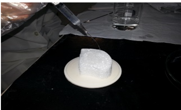
Figura 2: Irrigação da amostra

Com o auxílio de seringas, fez-se a irrigação de cada uma das fibras (Figura 2). Nesta etapa, após estas terem sido devidamente irrigadas, as amostras ficaram em estufa por 48h (Figura 3).