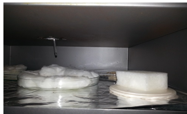
Figura 3: Amostras em estufa

A fase que seguiu-se após o período em estufa foi a da calcinação das fibras orgânicas por meio do forno Pechini, em 1200°C, por 2h. Esta etapa tem por objetivo a eliminação do material orgânico. Após esta fase, as estruturas das fibras orgânicas foram replicadas em hidroxiapatita, obtendo um material cerâmico.