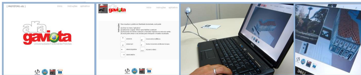
Figura 2: Na sequência, interface de acesso, página de instruções, utilização do aplicativo, tipos de visualizações: modelos tridimensionais e vídeos.

O aplicativo encontra-se em funcionamento para visualizações off-line . Sua interface e o tipo de visualização estão ilustrados pela figura 2. Neste sistema, o usuário dispõe de comandos básicos de visualização e interação, realizados através do teclado do computador, como: rotação, zoom.