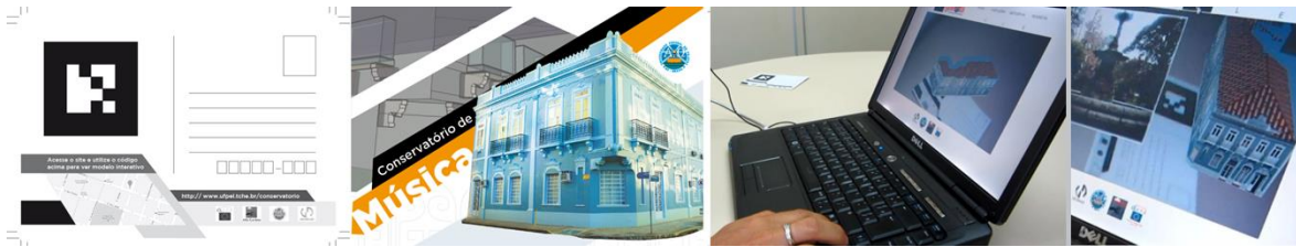
Figura 1: frente e verso de um Cartão Postal, destacando-se à esquerda, a impressão de um marcador responsável em acionar o sistema de RA. À direita, imagens que ilustram o funcionamento do sistema.

O aplicativo encontra-se em funcionamento para visualizações off-line . Sua interface e o tipo de visualização estão ilustrados pela figura 2. Neste sistema, o usuário dispõe de comandos básicos de visualização e interação, realizados através do teclado do computador, como: rotação, zoom.