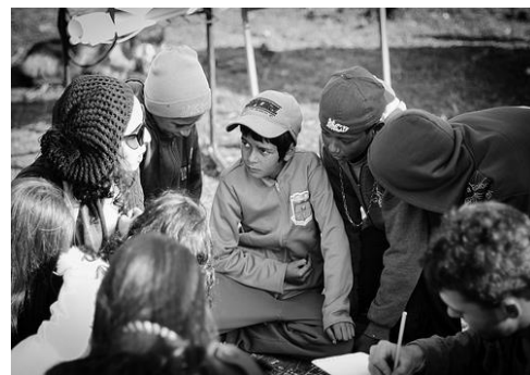
Figura 3 (Esq.) – Oficina com as crianças. Fonte: Matheus Costa, 2013. Figura 4 (Dir.) – DRUP na mateada cultural. Fonte: Matheus Costa, 2013.