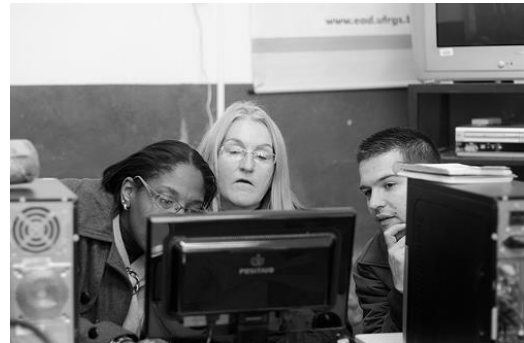
Figura 1 (Esq.) – Mapa após a primeira oficina. Fonte: Matheus Costa, 2013. Figura 2 (Dir.) – Professoras na plataforma virtual. Fonte: Matheus Costa, 2013.

De acordo com ROUSSEAU (1995, p. 86) “A infância tem maneiras de ver, de pensar e de sentir que lhes são próprias;”. É notório que a criança possui uma opinião diferenciada e buscando isso que a segunda oficina foi realizada com elas. O encontro com as crianças se organizou mediante reuniões com alunos das escolas municipais Coronel Sampaio e Presidente Kennedy, localizadas em pontos distintos e periféricos na cidade, buscando ampliar a abrangência dos resultados.