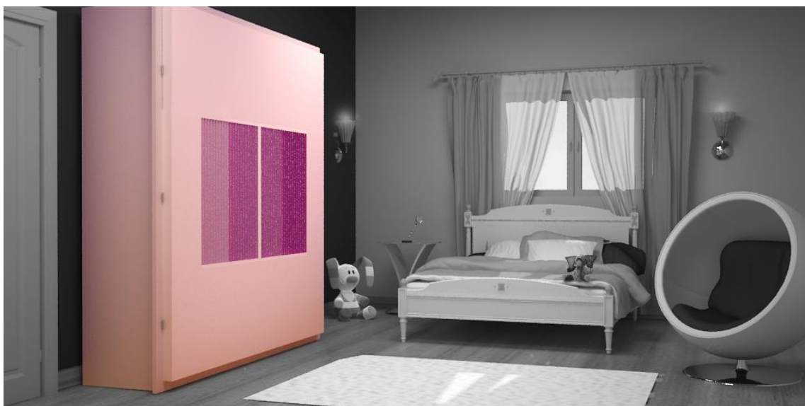
Figuras 2 – Roupeiro no quarto infantil