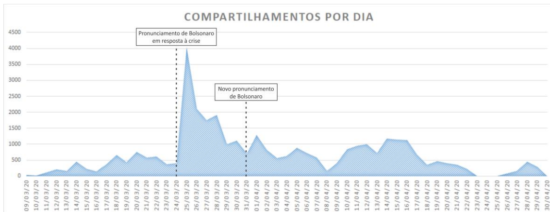
Figura 1. Distribuição do compartilhamento de mensagens ao longo do tempo

brasileiros. Assim, Bolsonaro realizou outro pronunciamento em 31 de março, novamente defendendo o retorno a normalidade. Identificamos novo aumento no compartilhamento de desinformação após o pronunciamento de 31 de março.