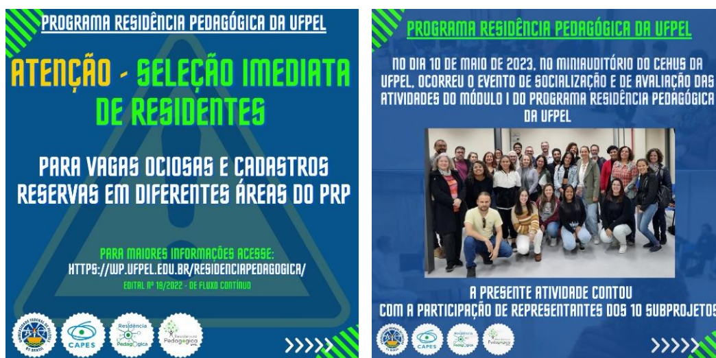
Figura 1: Alguns dos cards produzidos para o PRP/UFPEL.

O bolsista tem atuado no registro de atas de reuniões do PRP/UFPEL, na produção de Cards (Figura 1), envolvendo a seleção e espaços de formação, dentre outros temas pertinentes ao Programa, a exemplo do evento de avaliação do Módulo I, na busca de disseminação de informações e aumento da visibilidade do PRP na sociedade. O bolsista também atuou na busca de textos produzidos pelo grupo, desde o Edital anterior, os quais foram disponibilizados em: https://wp.ufpel.edu.br/residenciapedagogica/subprojetos/ , e atualmente está trabalhando na produção de um trabalho completo com base no formulário e no evento de avaliação do Módulo I, para divulgação no IX Encontro Nacional das Licenciaturas, VIII Seminário Nacional do Pibid e III Seminário Nacional do Programa Residência Pedagógica, a ser realizado em Lajeado/RS.