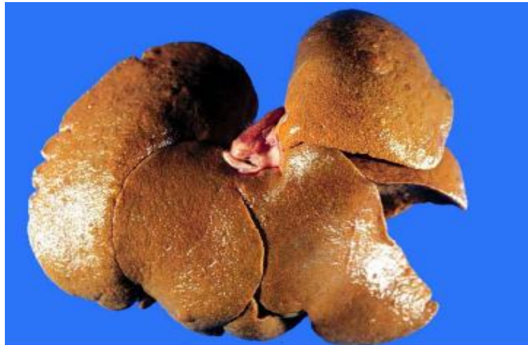
Figura 1: Fígado alaranjado com bordos arredondados.

Histologicamente, havia marcada vacuolização dos hepatócitos (Figura 2) distribuídas difusamente no parênquima do fígado. Nos rins havia nefrose tubular e glomeruloesclerose moderada.