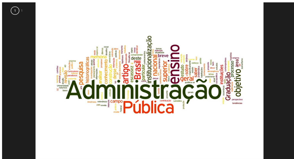
Figura 2 – Nuvem de palavras (representação dos objetivos dos trabalhos)

A figura 2 apresenta as palavras identificadas nos objetivos dos artigos analisados. Em conformidade com o número de citações realizadas a palavra ganha maior proporção na nuvem. Assim sendo, as palavras 'administração', 'pública' e 'ensino' se sobressaem com relação às demais palavras, reforçando a preocupação dos trabalhos em estudá-las, em comparação com aquelas que menos se destacaram. Diante do exposto, a nuvem de palavras agrega ao trabalho como outra ferramenta de análise dos principais objetivos dos artigos estudados, expandindo assim a gama de informações relacionadas à temática ensino de administração pública no Brasil.